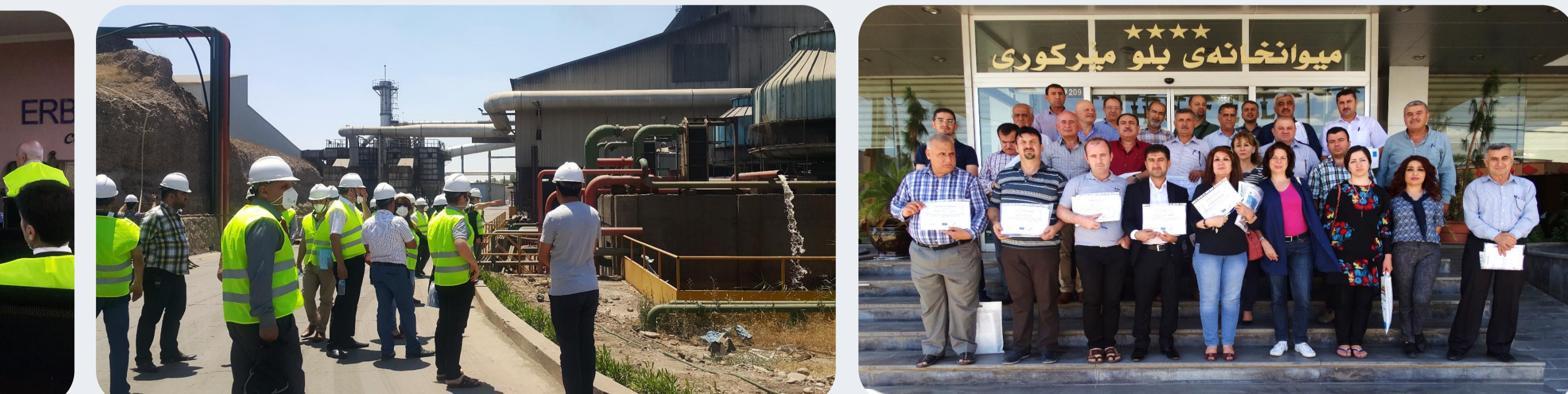
سه‌ردانی کۆمه‌پانیای ستیلی هه‌ولێر | سه‌ردانی کۆمه‌پانیای ستیلی هه‌ولێر | وه‌رگرتنی بره‌وانه‌ بو به‌شداریبووان