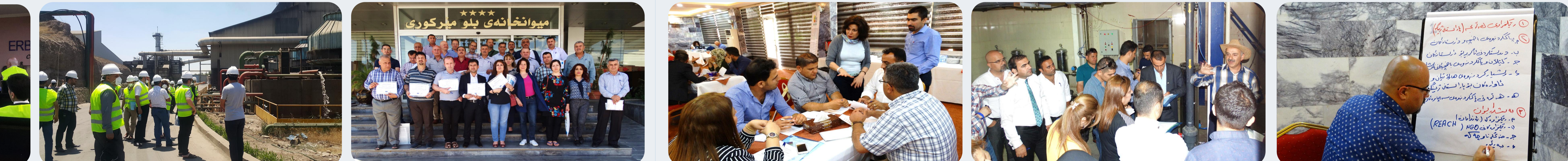
سه‌ردانی کۆمه‌پانیای ستیلی هه‌ولێر | سه‌ردانی کۆمه‌پانیای ستیلی هه‌ولێر | وه‌رگرتنی بره‌وانه‌ بو به‌شداریبووان | کارکردن به‌ تیم یاخود گروپ | کارکردن به‌ تیم یاخود گروپ | کارکردن به‌ تیم یاخود گروپ

پشکنه‌ری ژینگه‌یی لیکۆلینه‌وه‌ی رۆتینی خۆی نه‌جام ده‌دات له‌ ناوچه‌یه‌که‌ بو کاریه‌کی دیاری کراو یان هه‌ر ناوچه‌یه‌کی تر بێت بو دُنیا بوون له‌وه‌ی که‌ پروژمه‌کان به‌شێوه‌یه‌کی گشتی ده‌گونجه‌ت له‌گه‌ڵ یاسا ژینگه‌یه‌یه‌ گرنه‌گه‌کاندا، له‌ ده‌ره‌ نه‌جامدا ره‌گه‌زی به‌نه‌رتی ده‌بیت بو پاراستنی ته‌ندروستی هه‌ریه‌که‌ له‌ زه‌وی و هاو‌لاتیان به‌شێوه‌یه‌کی گشتی. ئه‌م شه‌وازی کارکردنه‌ زۆر نزیکه‌ و نه‌گونجی له‌گه‌ڵ په‌یره‌وه‌ ژینگه‌یه‌یه‌ نیو ده‌وله‌تیه‌یه‌کاندا، جگه‌ له‌وه‌ی توانای تومار کردن و ورد بو دیاری کردنی ناستی نمونه‌ی له‌ناوچه‌یه‌کی دیاریکراو ده‌بیت، به‌شێوه‌یه‌کی گشتی تیمی پشکنین له‌ ناو باره‌گای کارکردن و مه‌یدانی پروژمه‌کان کارمه‌پانان نه‌جام ئه‌ده‌ن که‌ جو‌ریک له‌ بالانس دروست ده‌کات له‌ نیوان هه‌مه‌چه‌شینی و رۆتیندا.